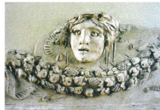
fig. 3 - Necropoli di Porto ad Isola Sacra: particolare della decorazione in stucco

con cornici e campiti da figurazioni ottenute con stampi e a mano libera (fig. 7).