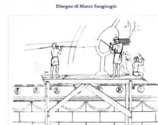
fig. 7 - Realizzazione di decorazioni a stucco

In conclusione si può affermare che le botteghe degli stuccatori erano ben organizzate ed articolate al loro interno: il lavoro dei plasmatori era strettamente legato a quello dei pittori ed in alcuni casi a quello degli architetti. Insieme si creavano, sulla base di un progetto, sia il disegno preparatorio che le decorazioni, quasi sempre basate sull'alternarsi e ripetersi di motivi. Dobbiamo a questo tipo di organizzazione la grande quantità e qualità degli stucchi ostiensi nei quali le tecniche di decorazione appaiono raffinate ed allineate con quelle documentate nella capitale dell'impero.