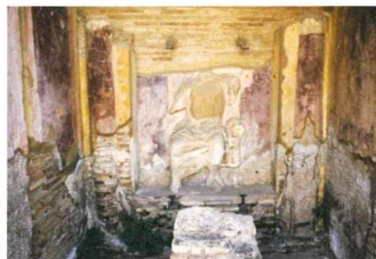
fig. 2 - Caseggiato del Serapide

Nel corso del II, fino agli inizi del III sec. d.C., gli stucchi si evolvono verso forme sempre più plastiche ed il colore assume una valenza diversa, volta ad esaltare forme e volumi. L'arte dello stucco si ispira ora sempre più a quella del marmo: si vedano gli stucchi del teatro ove essi ripetono le partizioni geometriche dei passaggi realizzati in marmo dei grandi archi trionfali (età di Commodo, 180-192 d.C.). Al III sec. d.C. si data il portale con timpano e fregio in stucco del Caseggiato del Serapide (fig. 2), accanto al quale si apre una nicchia con la figura del dio in altorilievo, realizzato in stucco. Sempre al III sec. d.C. si pone la decorazione su una parete delle Terme del Faro (fig. 6), da cui provengono anche altri numerosi frammenti relativi a ben tre soffitti dalla decorazione ampia e articolata. Dati relativi alla lavorazione dello stucco e alla sua evoluzione, dai primi raffinati esempi augustei fino a quelli severiani, si traggono dall'osservazione diretta dei materiali frammentari rinvenuti nel corso degli scavi. Dalle analisi compiute in occasione dei restauri sappiamo che la tecnica richiedeva maestranze abili, data la velocità di presa della materia.