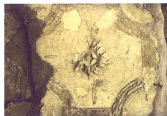
fig. 5 - Teatro: particolare della decorazione in stucco

La qualità artigianale è eccellente per tutto il periodo compreso tra gli inizi del I e quelli del III sec. d.C., quando comincia ad avvertirsi uno scadimento nella scelta del materiale che non trova analogia corrispondenza nella qualità artistica che permane alta perché supportata certamente da una tradizione di grande qualità.