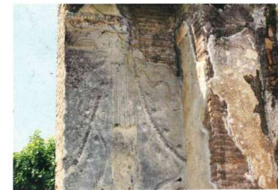
fig. 6 - Terme del Faro: ambiente con parete decorata

In conclusione si può affermare che le botteghe degli stuccatori erano ben organizzate ed articolate al loro interno: il lavoro dei plasmatori era strettamente legato a quello dei pittori ed in alcuni casi a quello degli architetti. Insieme si creavano, sulla base di un progetto, sia il disegno preparatorio che le decorazioni, quasi sempre basate sull'alternarsi e ripetersi di motivi. Dobbiamo a questo tipo di organizzazione la grande quantità e qualità degli stucchi ostiensi nei quali le tecniche di decorazione appaiono raffinate ed allineate con quelle documentate nella capitale dell'impero.